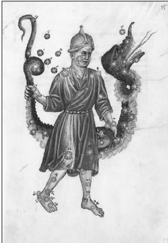
Abd ar-Rahman as-Sufi, Das Buch der Sterne, Prag, nach 1428; Schlangenträger mit Schlange (Bl. 15r); Farbabb. S. 163