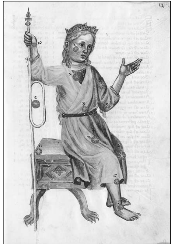
Abd ar-Rahman as-Sufi, Das Buch der Sterne, Prag, nach 1428; Cassiopeia (Bl. 12r); ©FB Gotha: Memb. II 141; Farbabb. im Farbteil S. 162