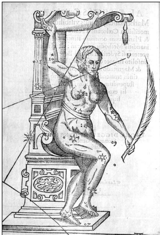
Das Sternbild Cassiopeia mit der Supernova von 1572 in realistischer Darstellung der Sterne nach Digges 1573

©Universitätsbibliothek Rostock: Sign. L IIb - 1156